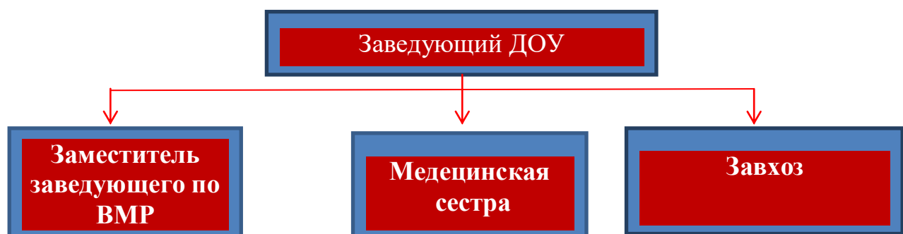
Схема. II направление – административное управление

Общее родительское собрание действует по плану, входящему в годовой план работы ДООУ. Общее родительское собрание собирается не реже 2 раз в год.